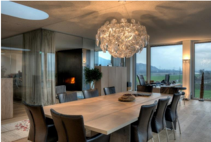
Büroteil 1 Süden / Westen